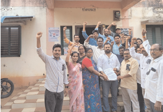
వినతి పత్రం ఆందోళన.