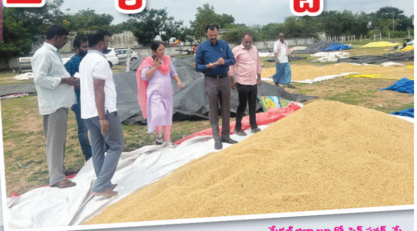
మేడ్చల్ జిల్లా బ్యారో, పెన్ పవర్, మే

24: అకాల వర్షాలకు ధాన్యం తడవకుండా ముందస్తుగా చర్యలు